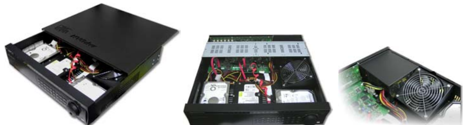
Вид с открытой крышкой